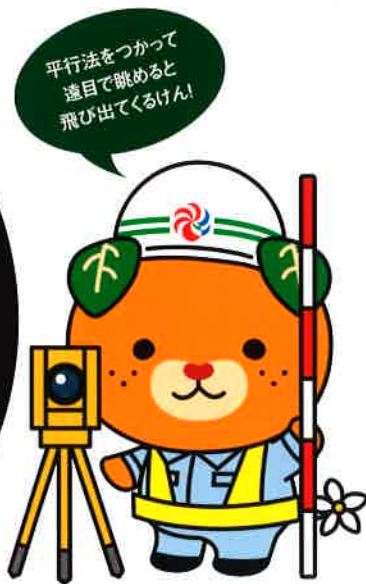
愛媛県イメージアップキャラクター みきゃん 許諾番号:2811005